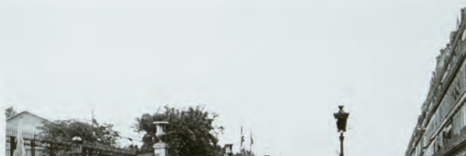
Fêtes de Jeanne d'Arc à Paris, 30 mai 1920, opérateur Lucien Le Saint, collection Archives de la Planète, film négatif nitrates, inv. 128654, réf. AI 111442. Département des Hauts-de-Seine, musée départemental Albert-Kahn, collection Archives de la Planète, TCI 15 : 42 : 47 : 01 (p. 136).