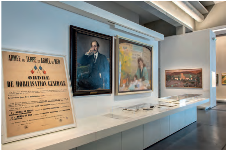
Vues de l'Atelier de l'histoire de la Contemporaine, bibliothèque, archives, musée des mondes contemporains, Nanterre, 2022. Scénographie : Olivia Berthon (Studio Vaste) ; architecte : Atelier Bruno Gaudin ; commissariat : Julien Gueslin et Valérie Tesnière (p. 245).