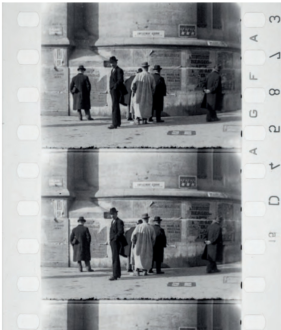
Marseille , 20 novembre 1919, opérateur Lucien Le Saint, film négatif noir et blanc 35 mm, inv. 109 082, réf. AI 100032. Département des Hauts-de-Seine, musée départemental Albert-Kahn, collection Archives de la Planète, TCI 05 : 02 : 39 : 23 (p. 137).